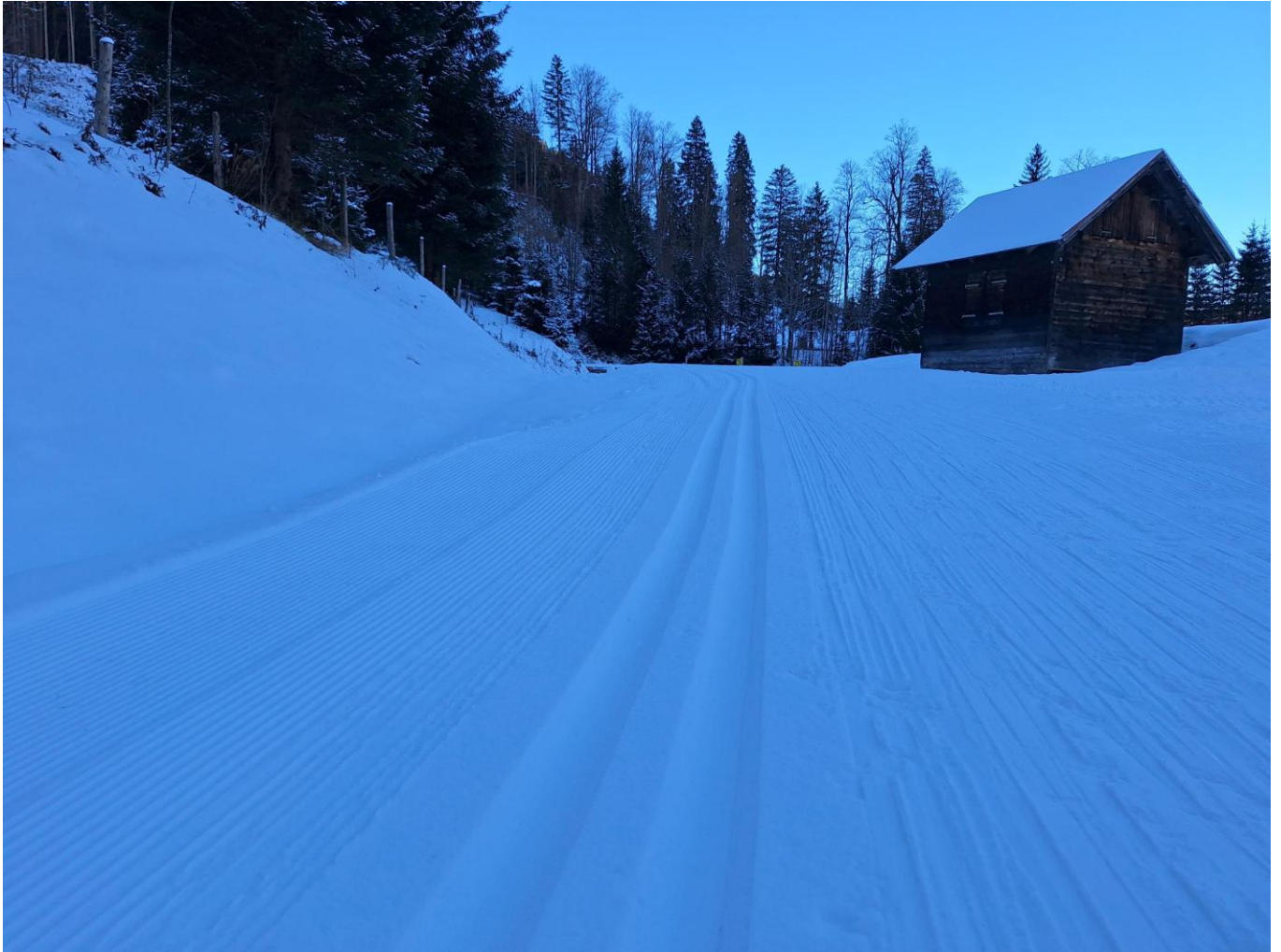
Loipen auf den Wiesen: